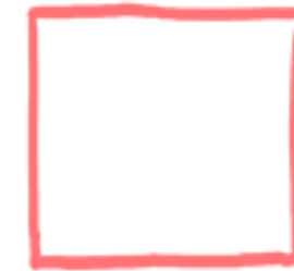
NOSIDEŁKO NA JABŁKO